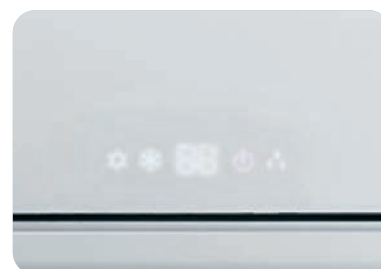
Скрытый дисплей передней панели