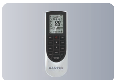
Функциональный пульт ДУ