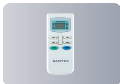
Функциональный пульт ДУ