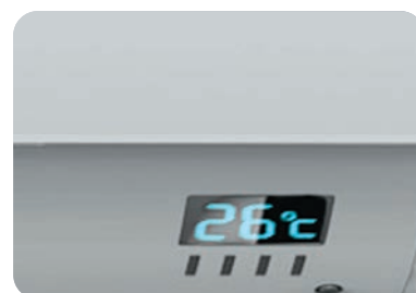
Дисплей на передней панели